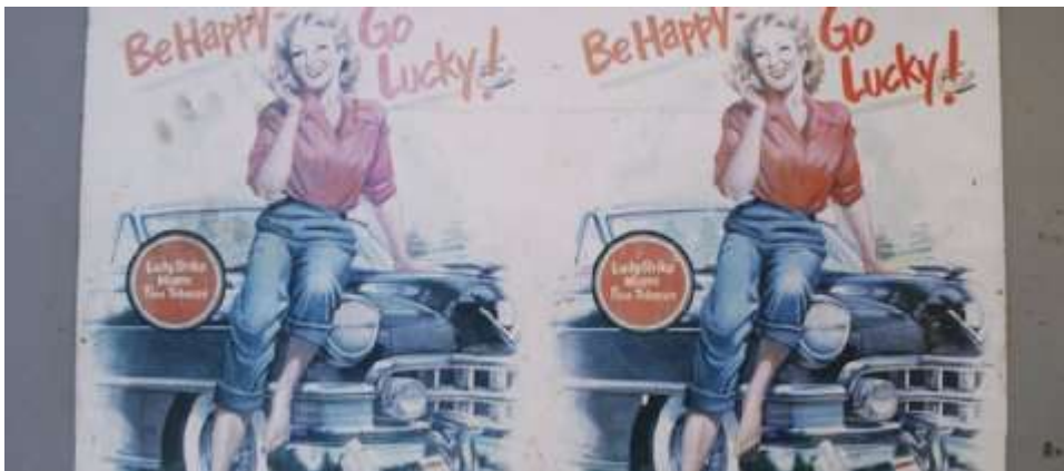
Tabakwerbung anno dunnemals.

Das Werbeverbot für Tabak soll ausgeweitet, der Einsatz von Zusatzstoffen eingeschränkt und die Warnhinweise auf Zigarettenverpackungen deutlich größer werden.