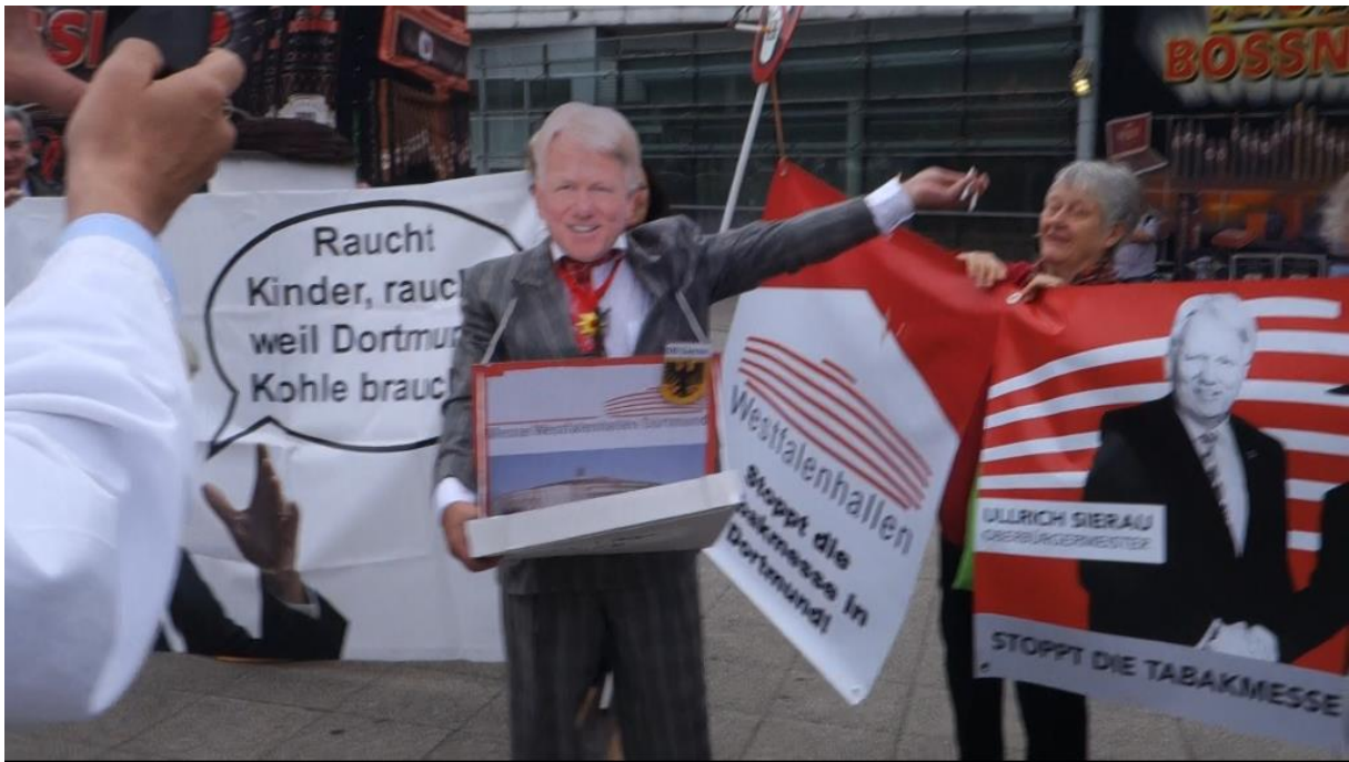
Der „Oberbürgermeister“ verteilt Gratiszigaretten vor der Halle