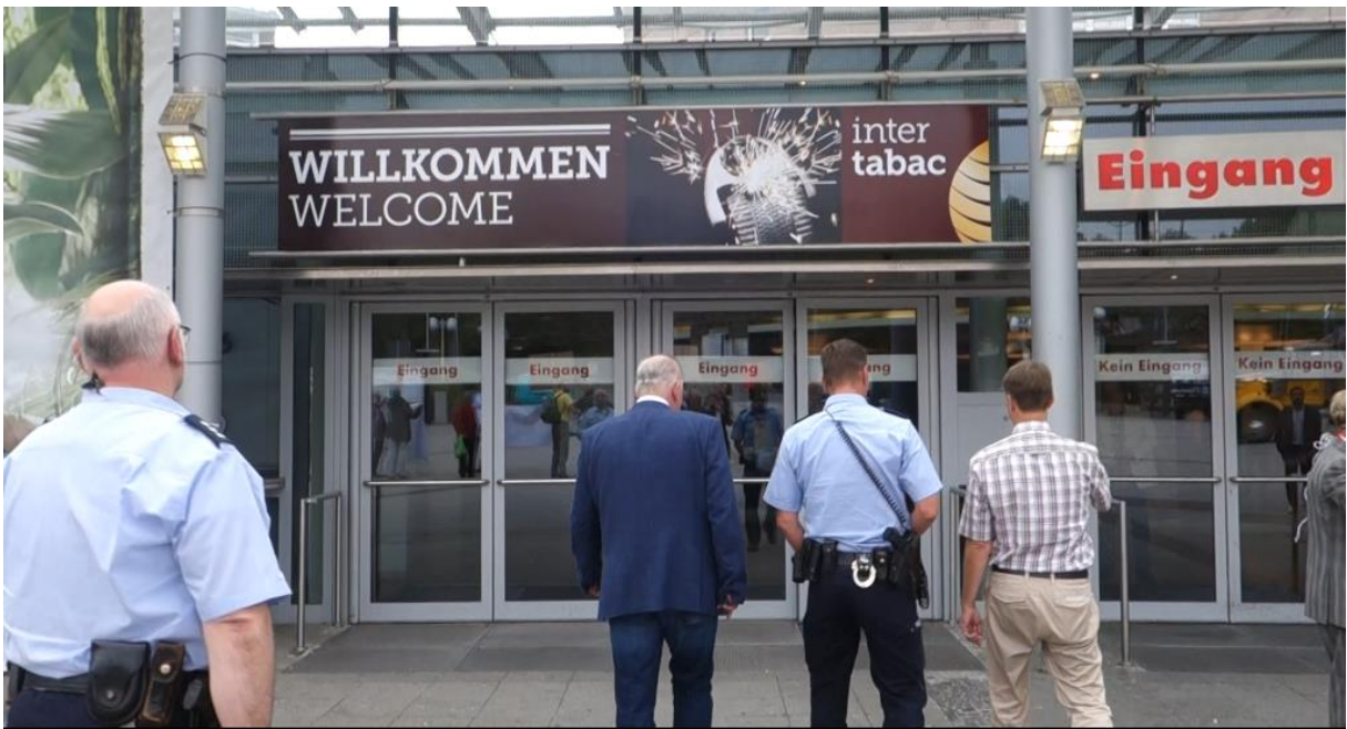
Die Polizei wird gerufen