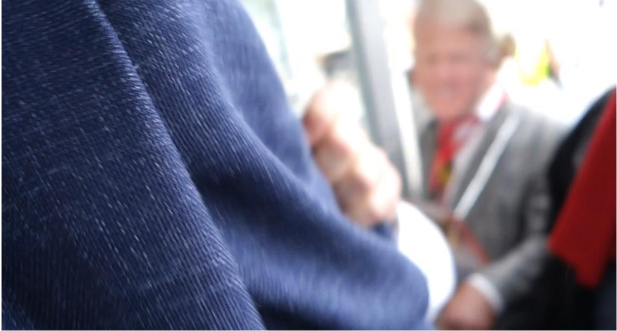
Ein Mitarbeiter der Westfalenhallen versucht, Filmaufnahmen zu verhindern.