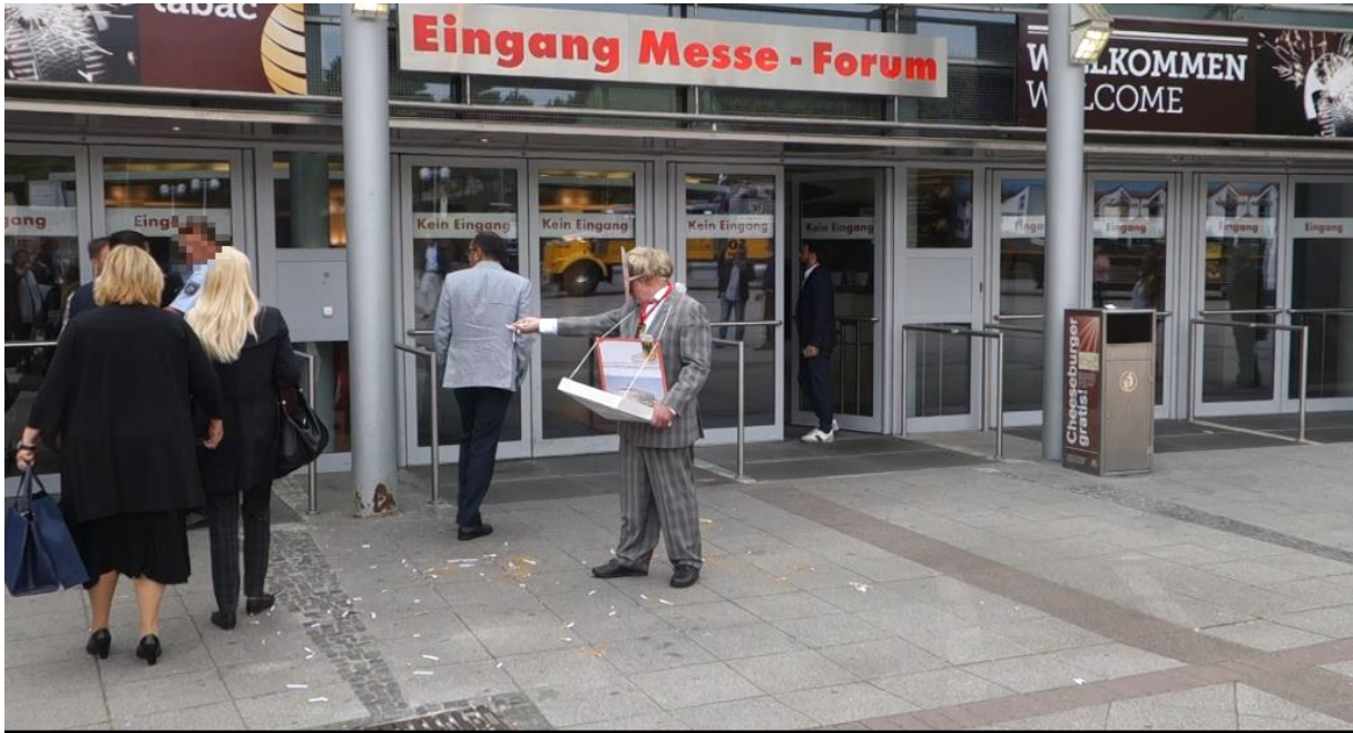
Der „Oberbürgermeister“ muss draußen bleiben