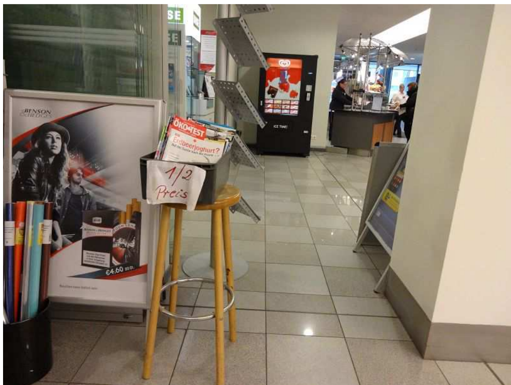
Aufsteller mit verbotener Tabakwerbung in der Mensa der TU Berlin