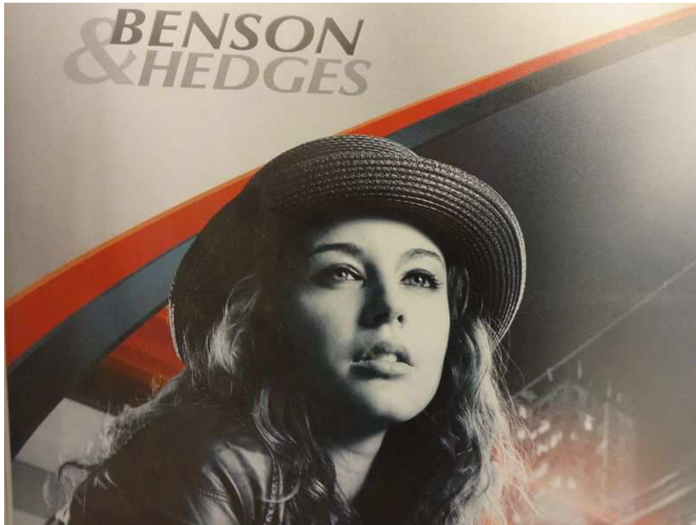
Japan Tobacco International (JTI) wirbt mit verbotener Tabakwerbung für seine Produkte