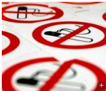
Diese Verbotsschilder werden Raucher künftig öfter zu sehen bekommen